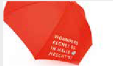
Regenschirm „hallesaale* Händelstadt“