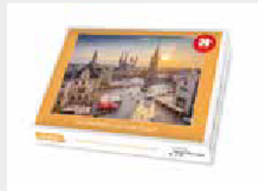
Puzzle „Der Marktplatz von Halle (Saale)“