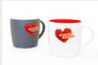
Tassenduo „Verliebt in Halle“