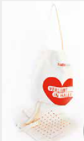
Beutel „Verliebt in Halle“